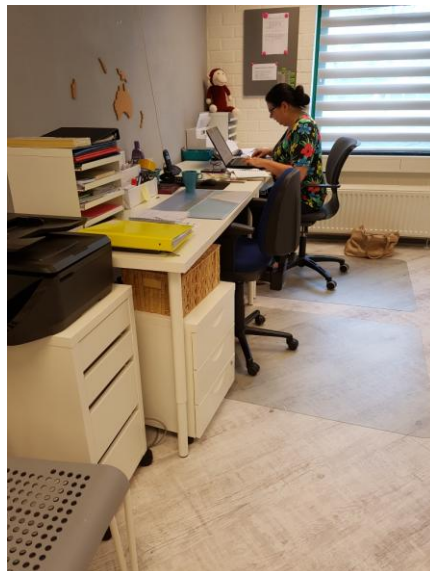
ons nieuwe kantoor 1