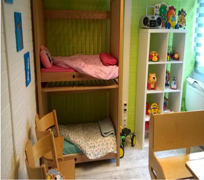
onze vernieuwde kinderopas 1